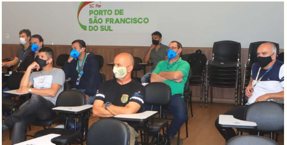
Servidores receberam treinamento para serem facilitadores e auditores da certificação

Antes disso, em novembro, haverá uma grande campanha interna para divulgar a implantação das normas ISO, junto com a política de qualidade que abrange Missão, Visão, Valores e Princípios que norteiam as atividades no Porto de São Francisco do Sul.