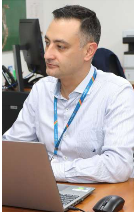
Desafio é aumentar carga movimentada

Trabalhamos pela eficiência plena do Porto, para ser indutor do desenvolvimento regional. Nosso objetivo é entregar um porto competitivo, com o máximo possível de movimento de carga, onde 'todos ganham': o porto e os clientes.