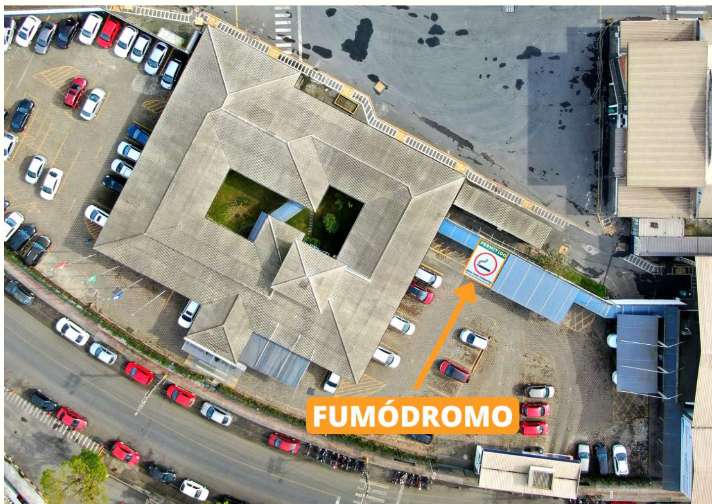
Nova área destinada ao tabagismo fica no estacionamento da administração, próximo à entrada principal, ao lado do bicicletário

O Programa de Educação Ambiental aos Trabalhadores (PEAT) é condicionante da Licença ambiental de Operação da SCPAR Porto de São Francisco do Sul – LO Nº 548/2006 – 2ª Renovação (2ª Retificação), emitida pelo Instituto Brasileiro de Meio Ambiente (Ibama).