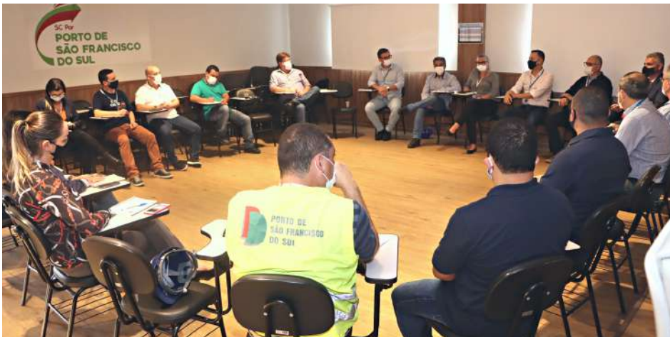
Assessores e gerentes apresentaram a rotina de trabalho de cada setor do complexo

Durante o encontro, os gerentes e assessores apresentaram as informações de cada setor, principalmente, as funções e rotinas de trabalho.